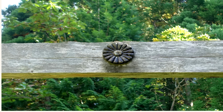
石塔山大山祇神社 鳥居に刻まれた菊の御紋 その由来は今もお謎に包まれている