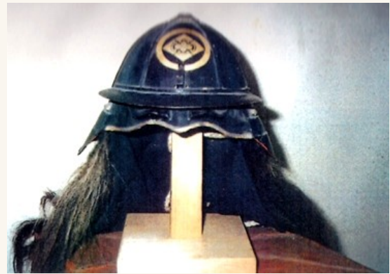
（左）川辺氏家紋「丸に菱木瓜」（右）川辺氏に伝わる兜 家紋が刻まれている