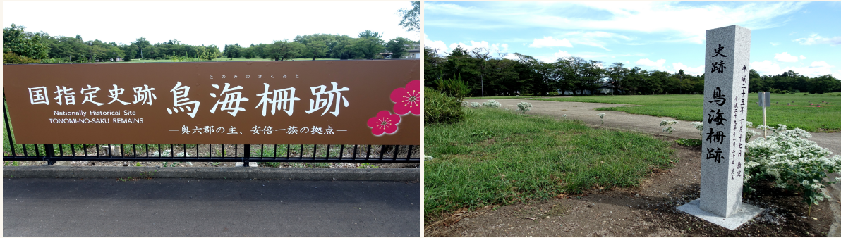
国指定史跡 鳥海柵跡（岩手県金ケ崎町） 奥六郡の主、安倍一族の拠点 孝幸が富忠の首を持ち帰った安倍宗任の陣