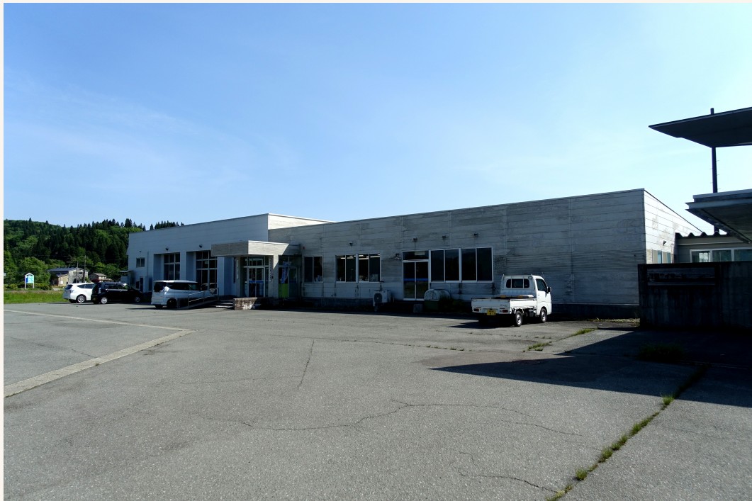
秋田岩見沢湊安東領域 秋田市河辺市民センター岩見三内連絡所付近 川辺一族が移住した地