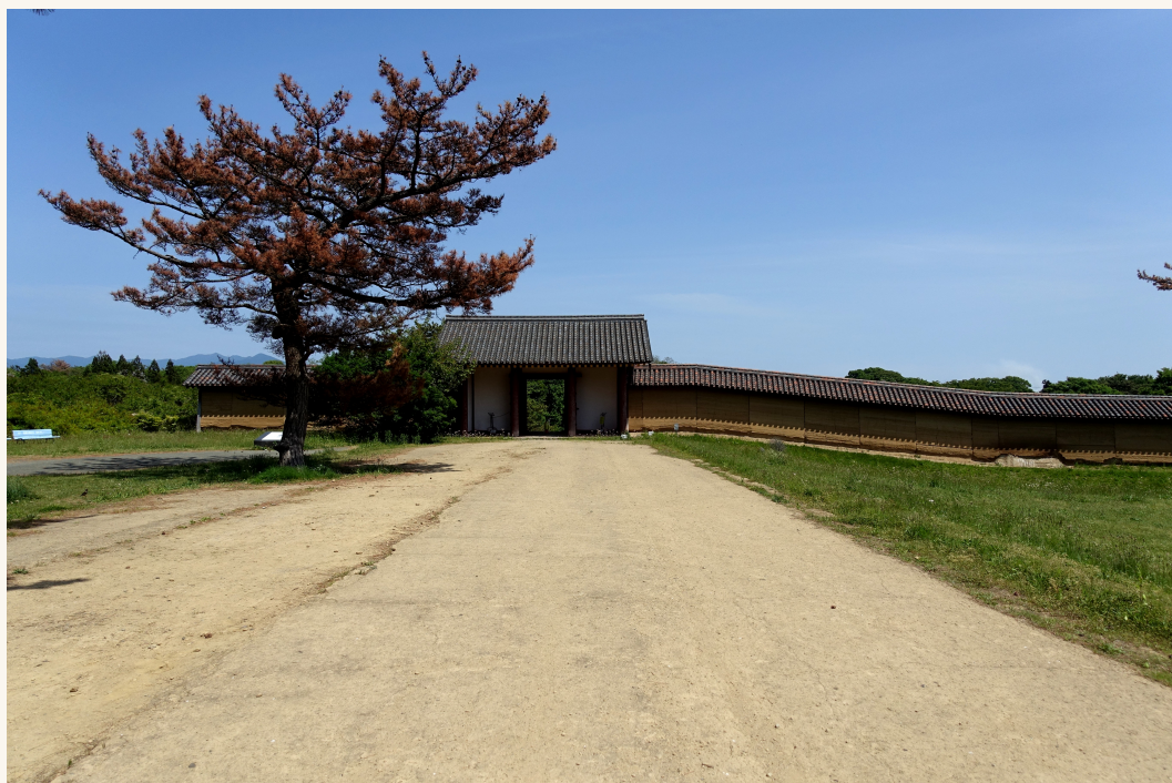
秋田城跡（飽田城・現秋田市）川辺義孝が救済した古代城柵の跡

義孝の妻は藤原経清（つねきよ）の姉妹であり、経清は後の平泉藤原氏の祖・藤原清衡（きよひら）の父にあたる。川辺氏には藤原の血も流れていた。